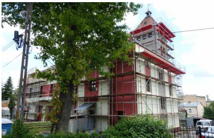
Przebudowa dachu budynku OSP w Dynowie