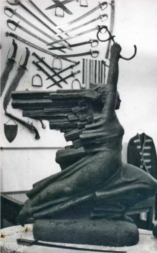
„W hołdzie warszawskim powstańcom”