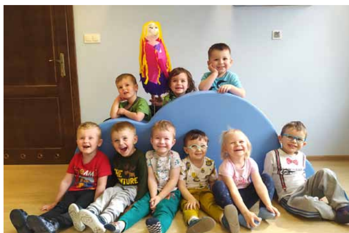
I Dzień Wiosny

Żłobek Miejski w Dynowie