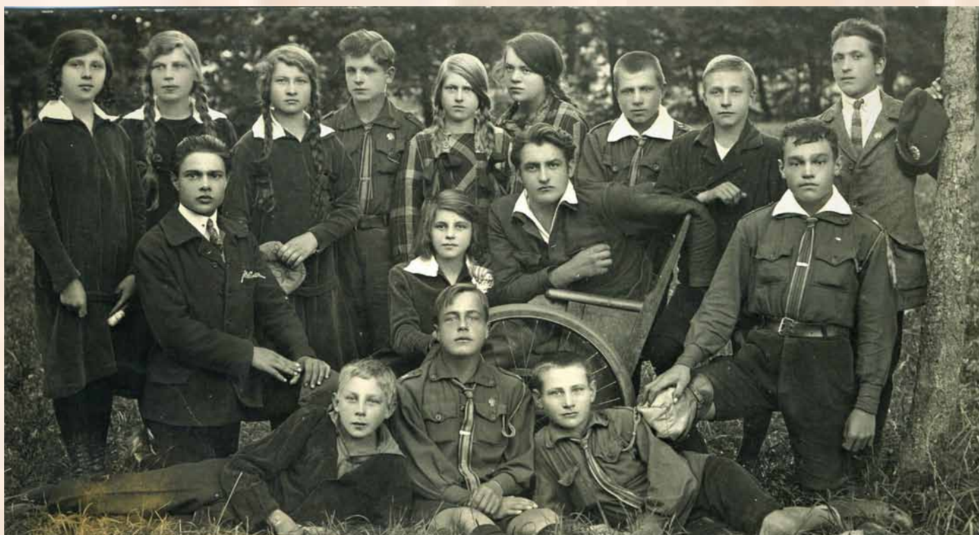
Wśród uczniów Seminarium Nauczycielskiego w Świsłoczy