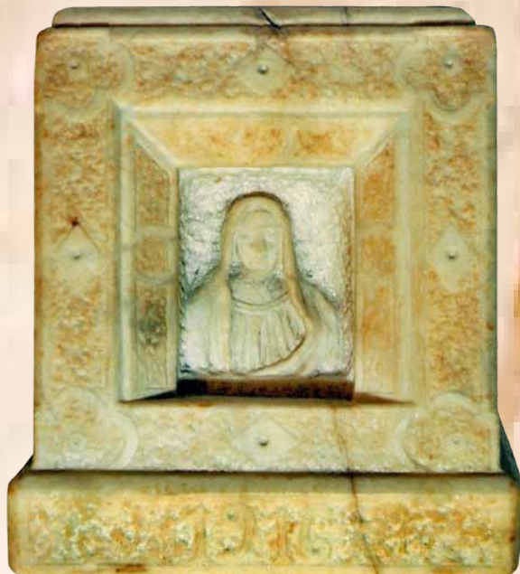
Rzeźba wykonana w 1916 r. – praca w zbiorach rodzinnych