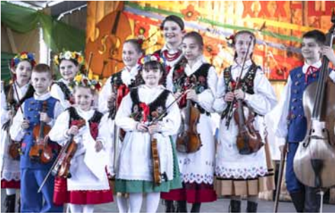
Nagroda specjalna dla Fundacji Iskry Tradycji.

Wyniki Jubileuszowego przeglądu „Pogórzańska Nuta” 2021