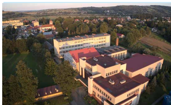
Z lotu drona.

sce w biegu na 300 m Jakub Duchniak z czasem 42,11 sek., III miejsce w biegu na 100 m Kacper Kocyło z czasem 12,77 (el. 12,57). Opiekunem zawodników był p. Damian Chudzikiewicz.