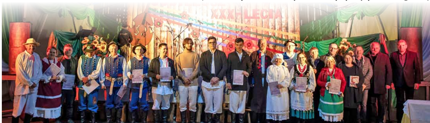
Wspólne zdjęcie uczestników wraz z organizatorami.