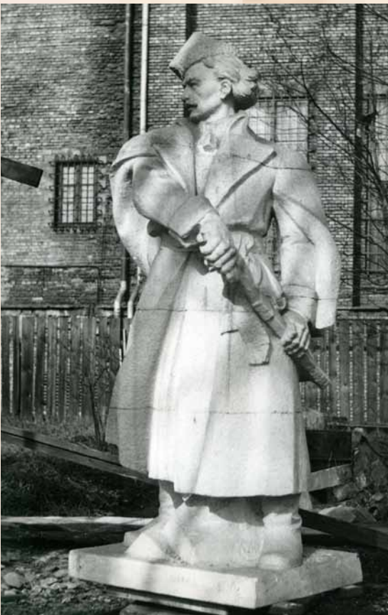
Pomnik Jana Kilińskiego w Trzemesznie