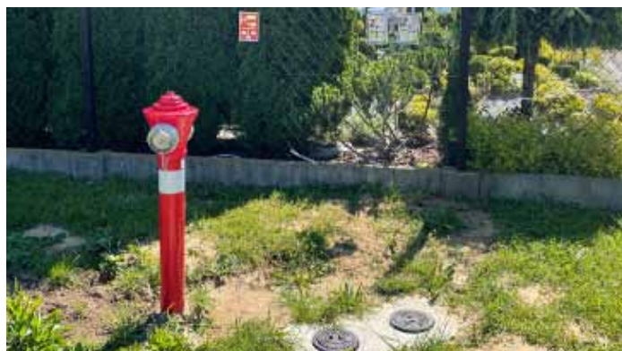
Hydrant w ciągu nowej sieci wodociągowej, fot. z archiwum Urzędu Miejskiego w Dynowie

O kolejnych działaniach związanych z inwestycją mieszkańcy będą informowani na bieżąco na stronie internetowej Miasta Dynów www.dynow.pl i w Dynowskim Kwartalniku Samorządowym.