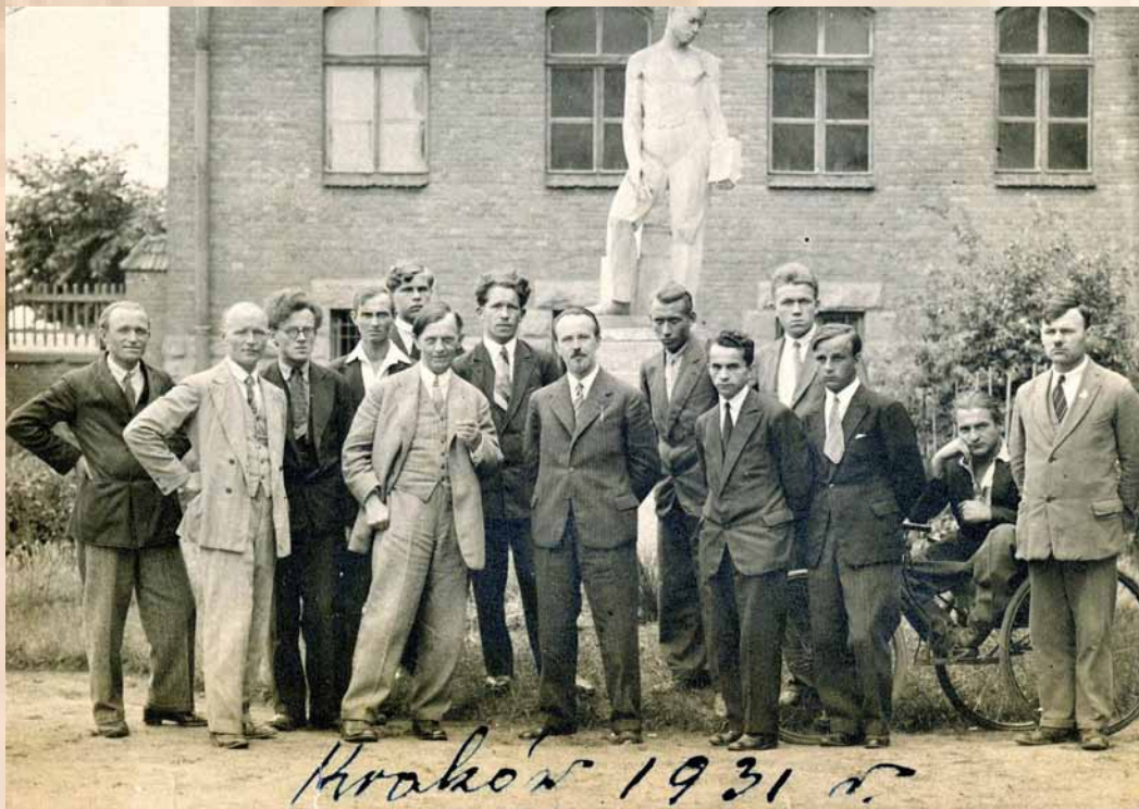
W Państwowej Szkole Sztuk Zdobniczych i Przemysłu Artystycznego w Krakowie

W roku 1936 zaczął brać udział w wystawach organizowanych w Instytucie Propagandy Sztuki i w Towarzystwie Zachęty Sztuk Pięknych w Warszawie: salon IPS 1937 r., salon IPS 1938 r. (pierwsza nagroda za rzeźbę „Nić Ariadny”), konkurs na rzeźbę religijną 1936 r., konkurs na projekt pomnika J. Piłsudskiego 1937 r.