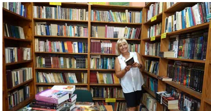
Pierwszy czytelnik po otwarciu przestrzeni bibliotecznej

Grażyna Paździorny Anna Marszałek