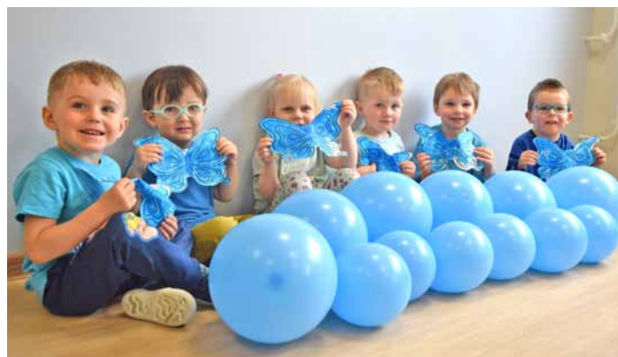
Jesteśmy z Wami niebieskimi motylami